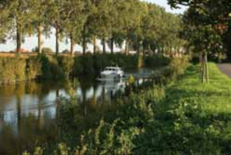
Genieten tijdens een boottochtje