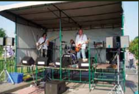
Muziekgroep op Motjesbrug