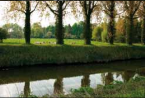
Zalig grazen langs het kanaal