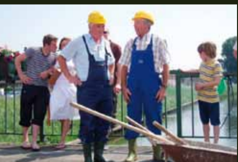
Toneelgroep "Kunst veredelt"